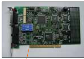
制御PC側(PC - LINK (PCI))